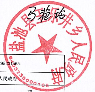
盐池县王乐井乡滩羊精深加工交易中心建设项目绩效目标申报表