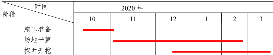
表 2-7 主体工程施工进度安排表

本项目预计于 2021 年 10 月开工，2022 年 3 月完工，总工期为 6 个月。主体工程进度安排见表 2-7。