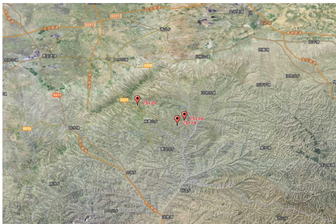
图 1 地理位置

长庆油田分公司陕北石油预探项目组冯 120 等 3 口油探井项目位于宁夏吴忠市盐池县麻黄山乡，3 口井地理坐标为分别为冯 120：N37°14'35.26"，E107°4'55.56"；冯 124：N37°9'30.06"，E107°15'4.40"；冯 138：N37°10'29.89"，E107°16'52.90"；项目位于宁夏盐池县麻黄山乡，周围交通网密集，有 S309 惠红线、S201 盐麻线等，该项目区有 S201 盐麻线等主要公路干线通过，交通便利，项目地理位置见图 2-1。