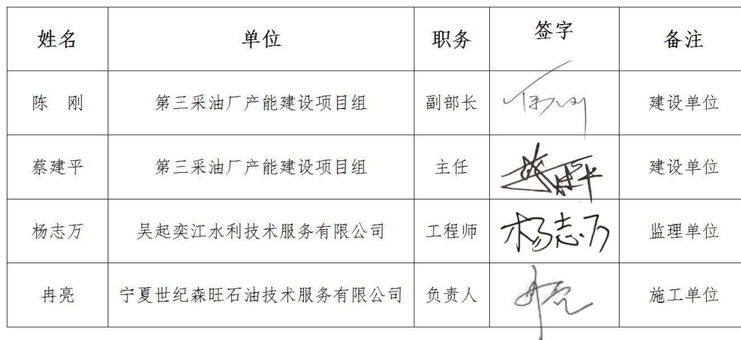
六、验收组成员及参验单位代表签字表