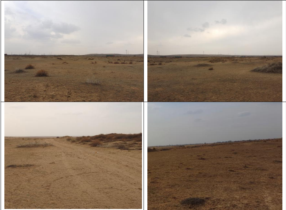
郭 81 ( 古 56 )