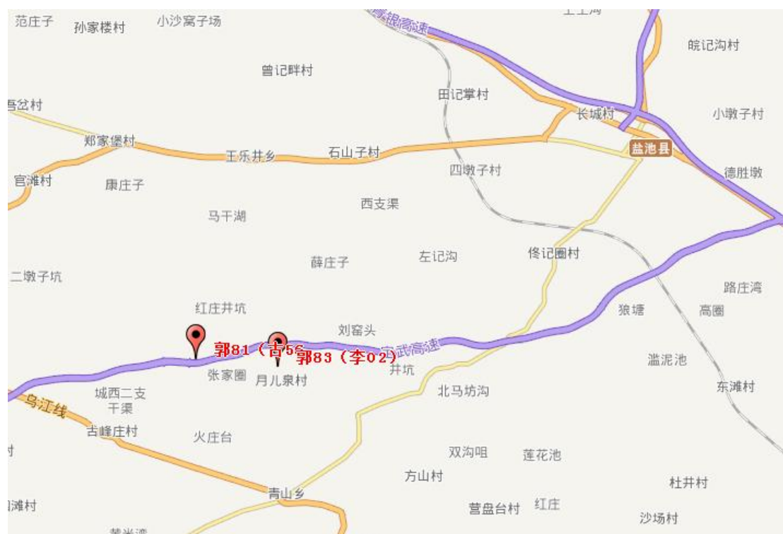
图 1 地理位置