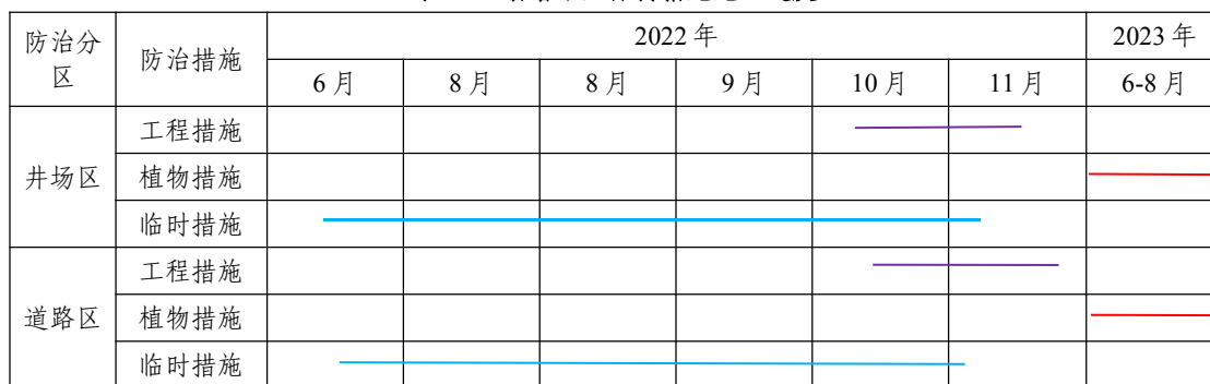
表 5-4 新增水土保持措施施工进度

本项目于 2022 年 6 月开工建设，计划 2022 年 11 月完工，工期为 6 个月。新增水保措施施工进度安排如下：