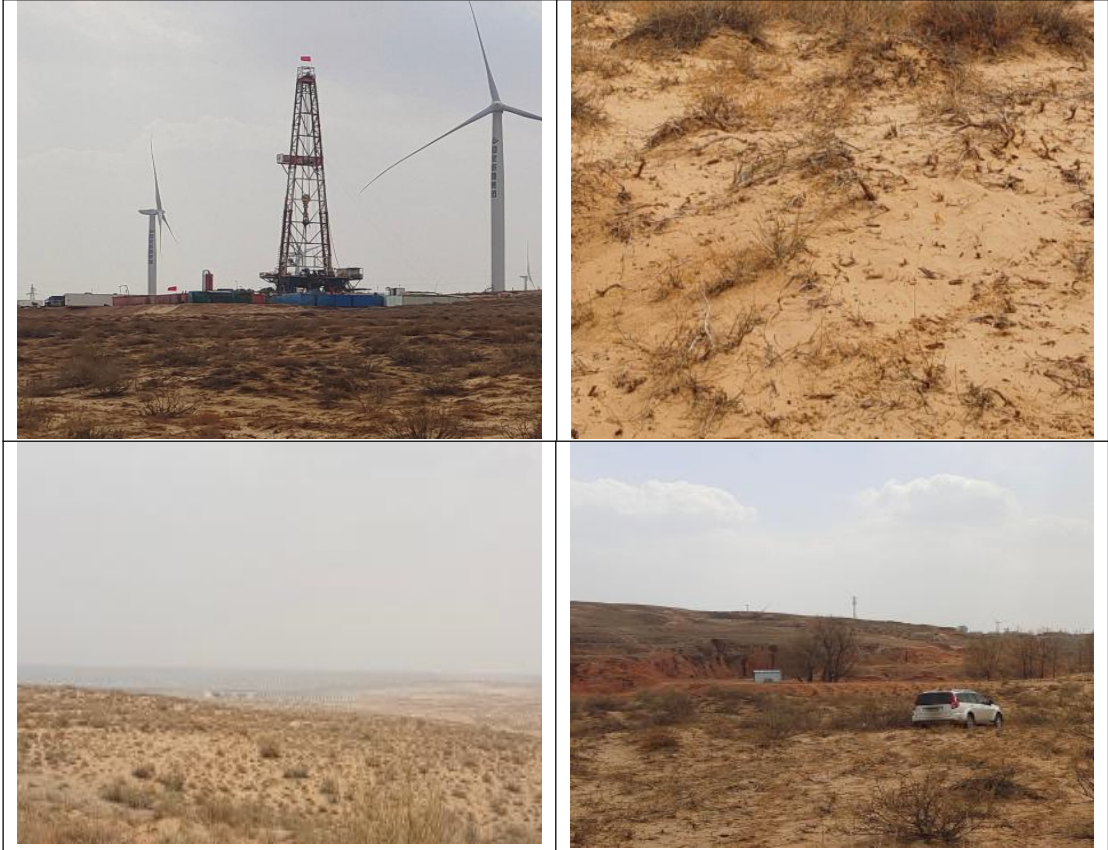
郭 83 ( 李 02 )