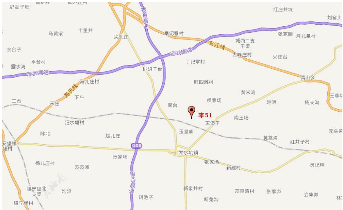
图 2.1 项目地理位置

标为，李 51：37°29'41.50"，106°58'46.18"。项目位于宁夏盐池县大水坑镇宋堡子村，周围交通网密集，交通便利，项目地理位置见图 2.1。