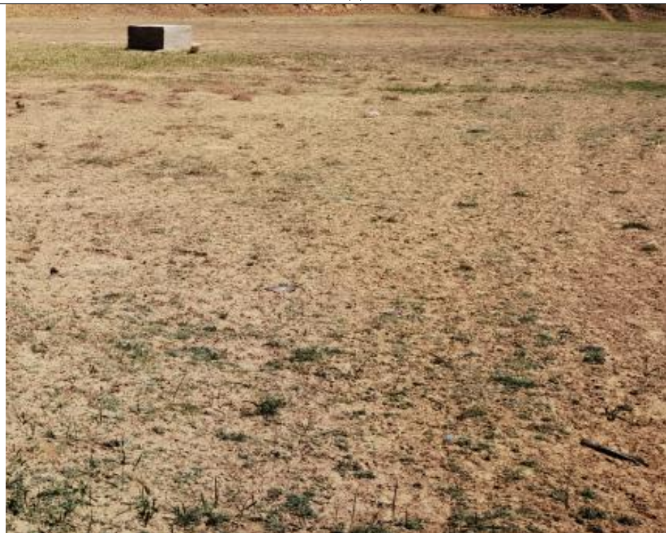
李 53 井