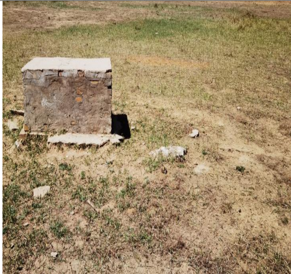
李 53 井