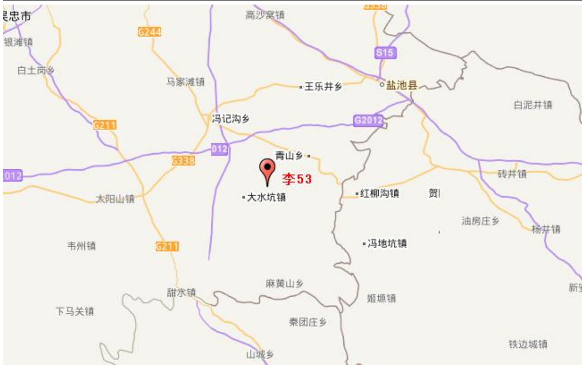
图 2.1 项目地理位置