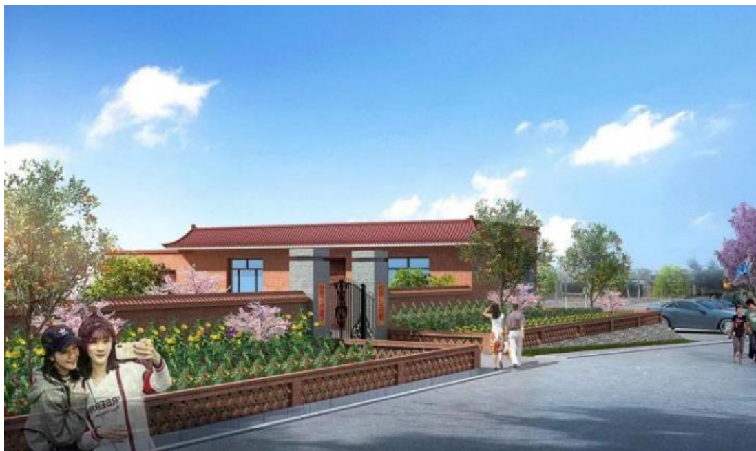
图 3 现状农宅效果图