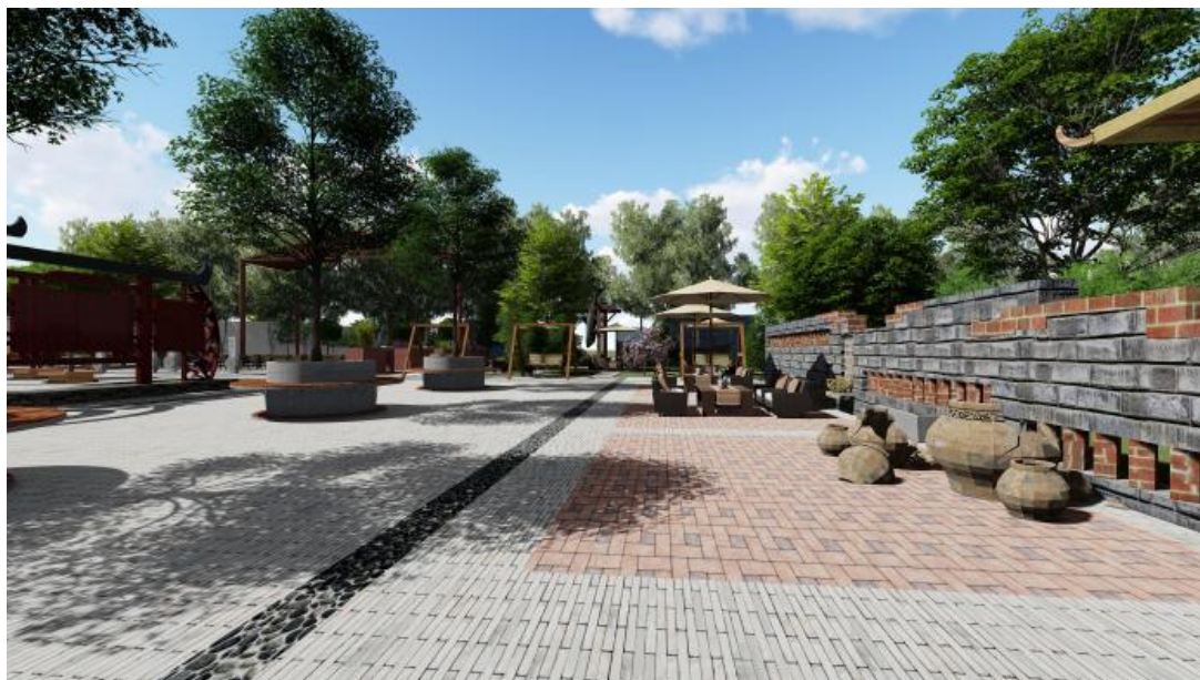
图 4 村庄公共空间效果图