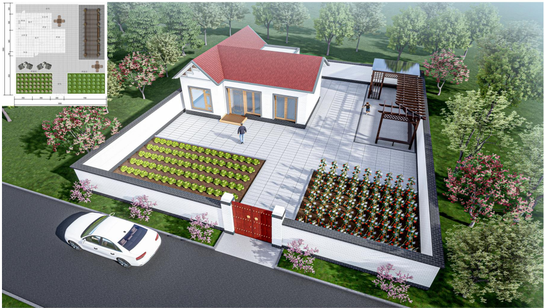
图 5 新建农宅设计方案图 1