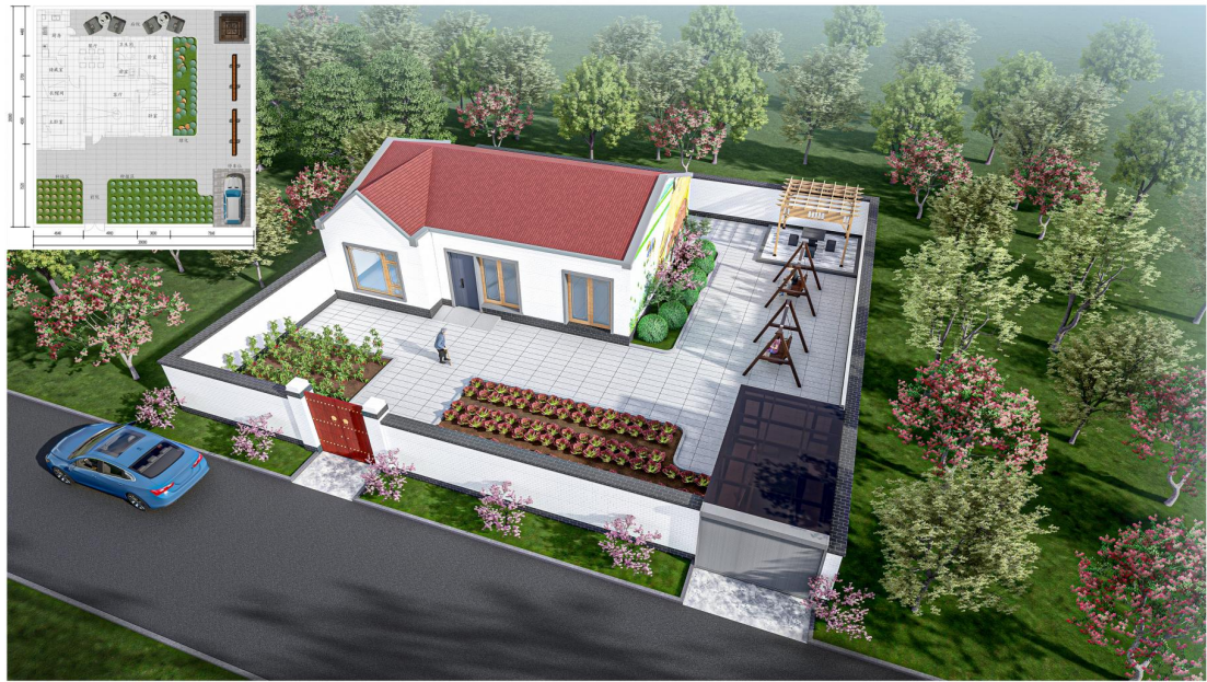
图 6 新建农宅设计方案图 2